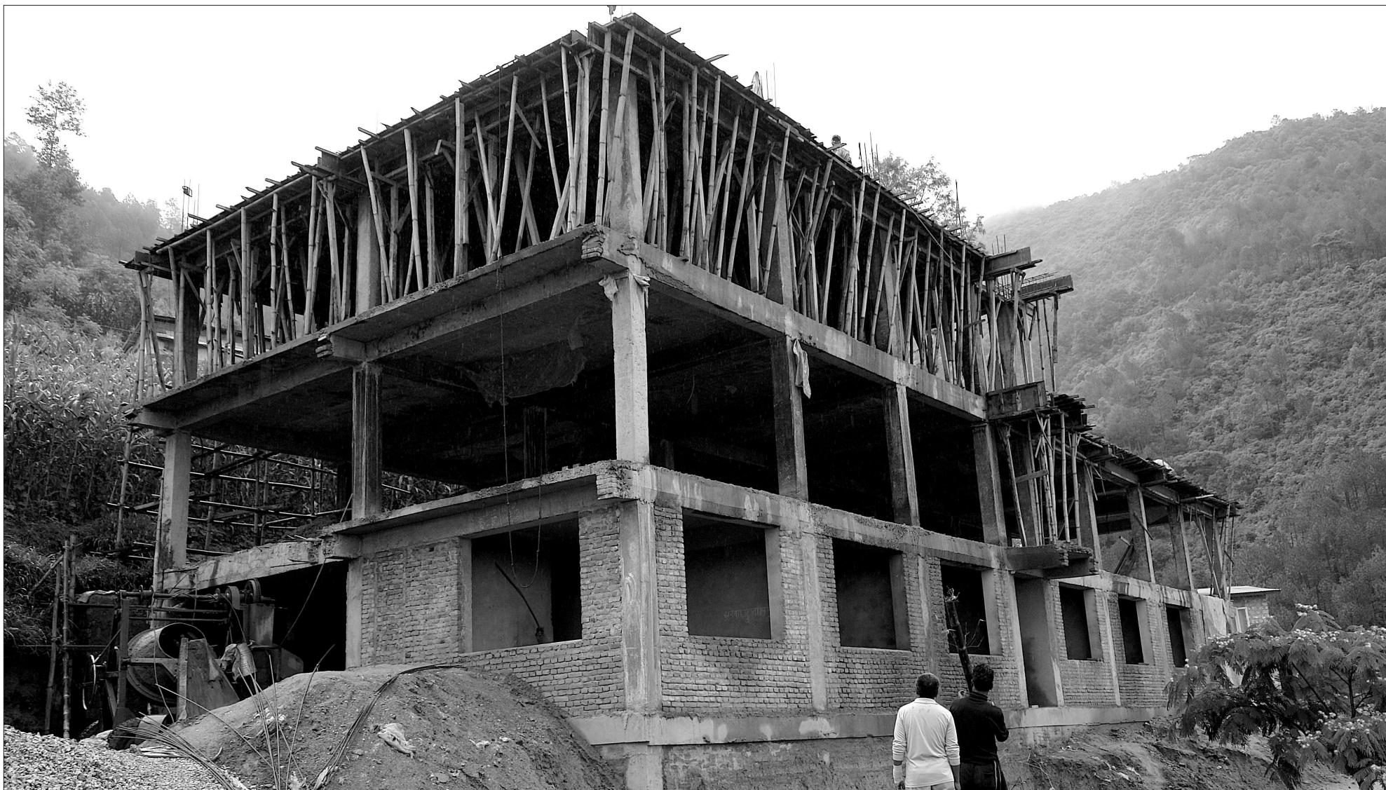
The construction of Nava Kiran Plus super specialty palliative care and treatment center (SSPCTC) in Shivapuri hills north of Kathmandu is halfway. It is hoped that the construction will be completed by September this year.