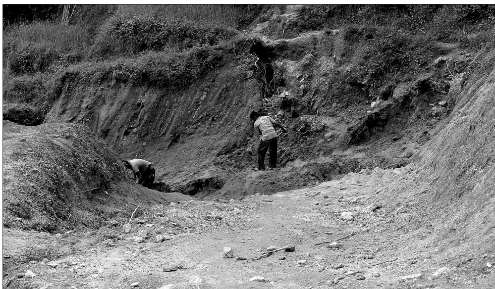
Once it starts raining construction materials could not be transported to the site as the road is too slippery and steep thus the work is delayed.