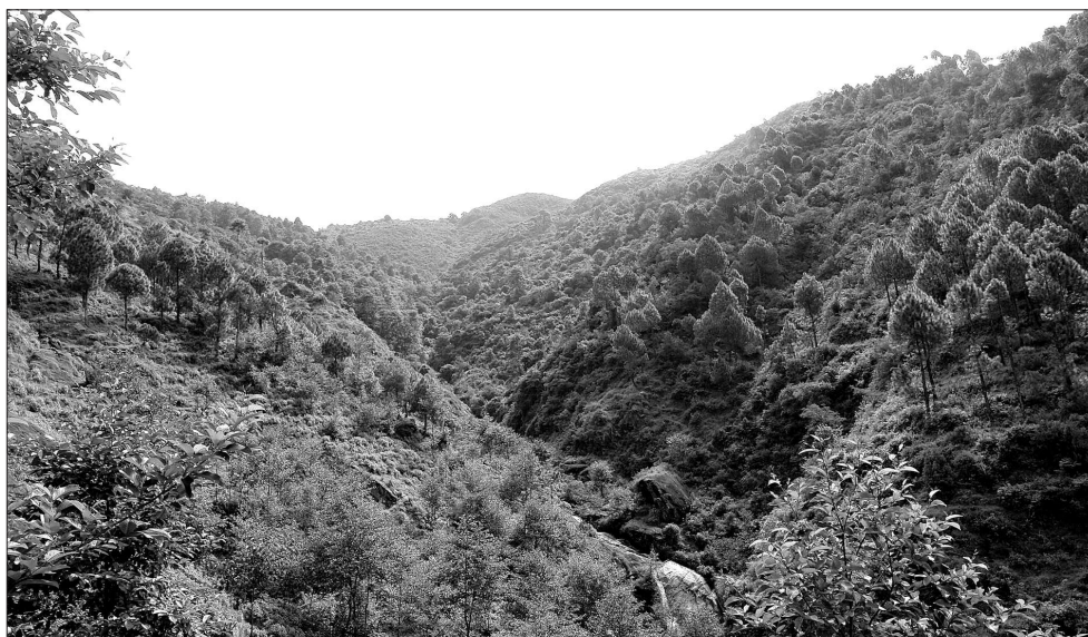
A landslide around the construction site, flood in the nearby stream, road blocks due to heavy rain anything can happen.