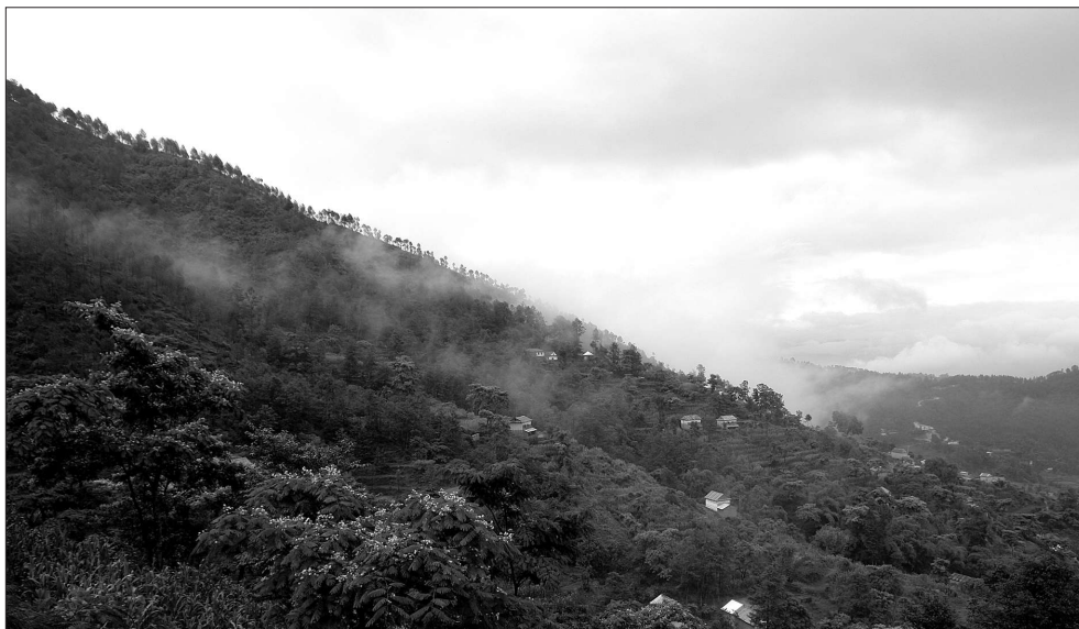
I miss 4WD vehicle, Black topped roads and dry seasons these days.